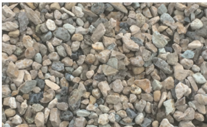
GRAVIER SEMI-ROULÉ 16 - 32