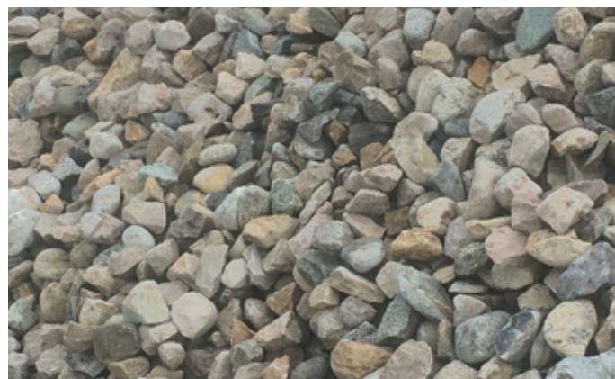
GRAVIER SEMI-ROULÉ 32 - 63