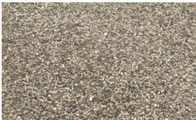
GRAVIER SEMI-ROULÉ 4 - 8