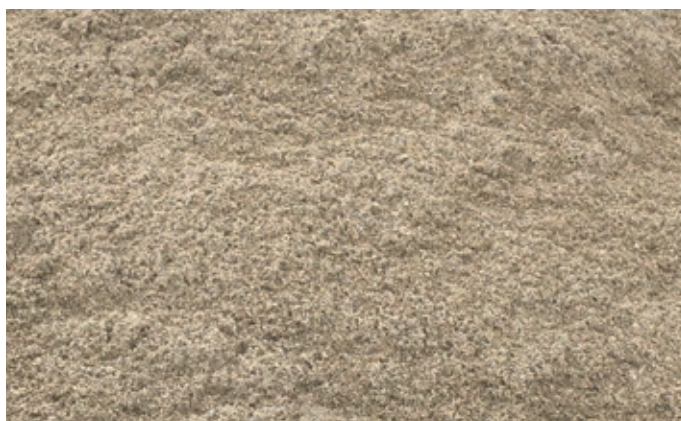
SABLE LAVÉ 0 - 4